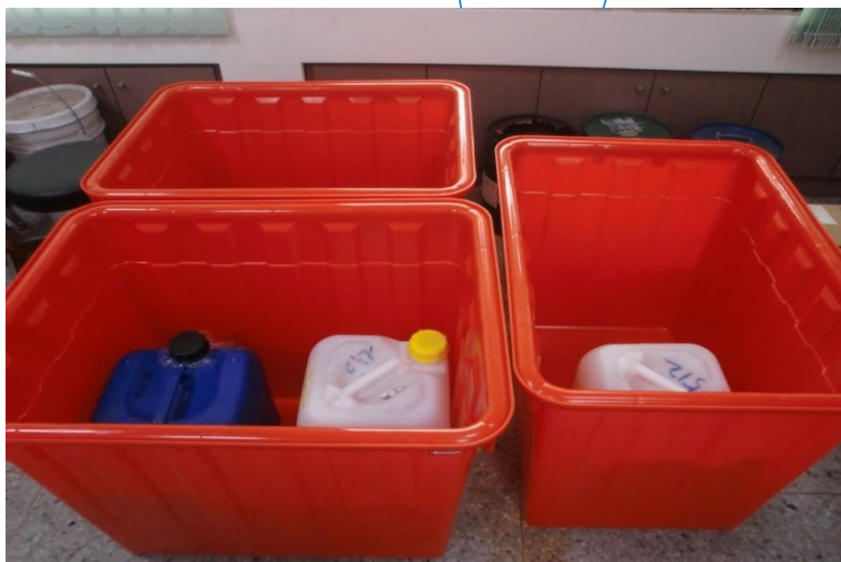
容積1.1倍以上承接盤(桶)