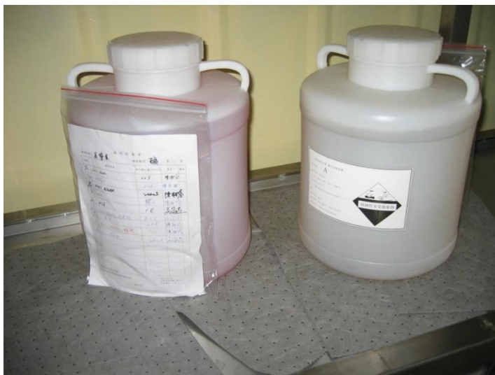
高密度聚乙烯(HDPE)桶盛裝