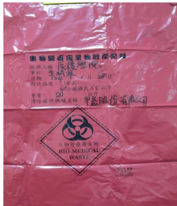
生物醫療廢棄物(專用收集袋)